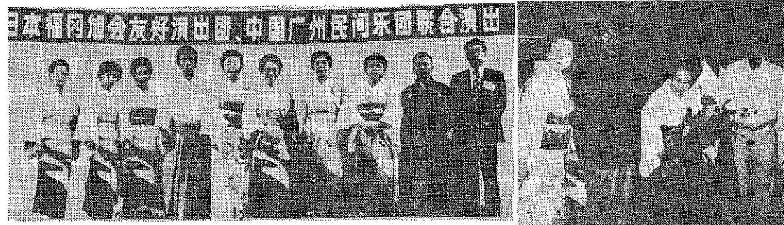
中国広州民間楽団と合同演出 日本福岡旭園友好演出

福岡市と中国広州市とは友好都市の縁を結んである関係で、中村師は幾度か海外旅行演奏の体験者だけに中国訪問を思い立ち、会員